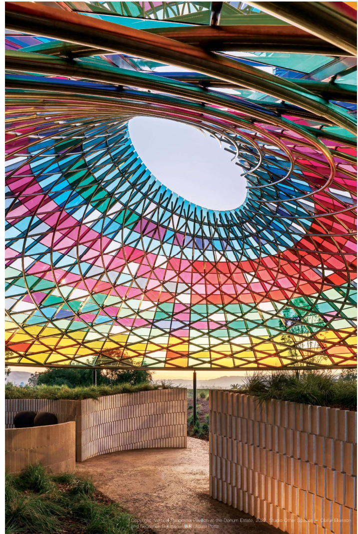
CapWright, Vertical Panorama Pavilion at the Donum Estate, 2022. Studio Other Spaces © Daniel Elsson and Geordan Bulman. 摄影：Susan Pitts

钢琴的音色如涟漪持续波动，电子乐加持了多重效果，四散开去， 好比日升月落，潮汐涨落的变奏，风在林间低声吟唱，光与影在万物上摇曳起舞， 作曲的过程对鲍勃而言是及时攫取瞬间的感觉，将其变为旋律。